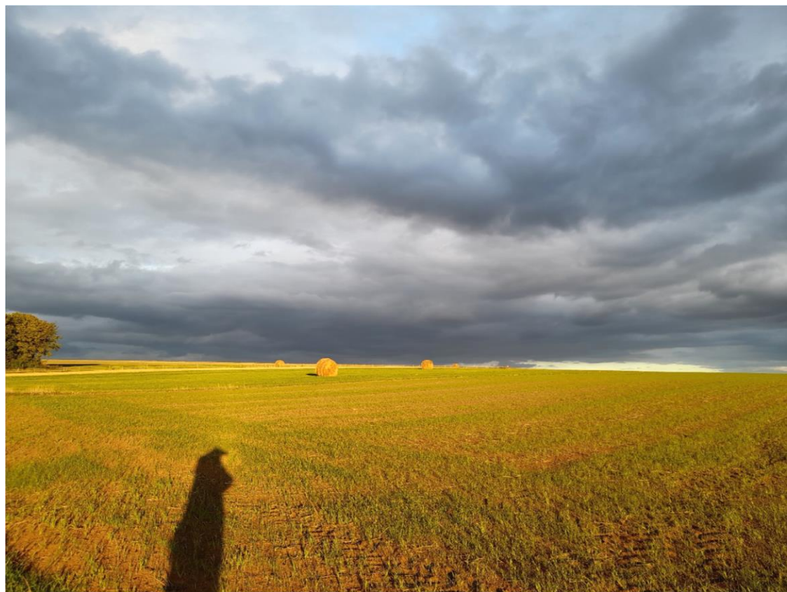
Foto: Höhe zwischen Deudesfeld und Meerfeld