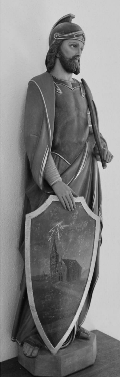
Foto: Donatus-Figur in der Willwerscheider Kapelle