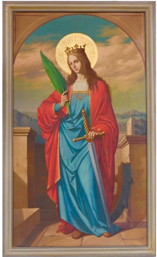
Foto: Gemälde in der Kirche in Eckfeld

Katharina (griech. „die allzeit Reine“) ist ein klassisches Beispiel dafür, dass es hochverehrte Heilige gibt, obwohl ihre Persönlichkeit historisch nicht einwandfrei zu fassen ist. Ihre frühe Verehrung aber ist durchaus belegbar.