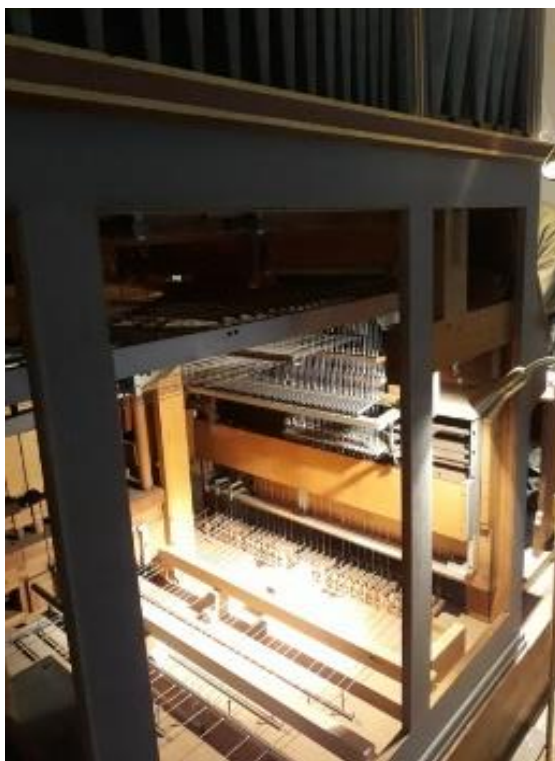
Foto: Dieser Blick in das komplizierte Innenleben der mechanischen Orgel ist möglich, da zur Zeit der Motor ausgetauscht wird.