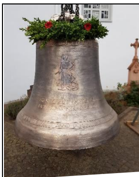
Neue Glocke von Manderscheid