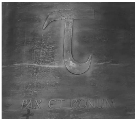
Foto von der Rückseite der neuen Manderscheider Glocke mit der Grußformel des Hl. Franziskus: "PAX ET BONUM". d.h. übersetzt "Frieden und Wohlergehen"

"Dann werden sie ihre Schwerter zu Pflugscharen umschmieden und ihre Lanzen zu Winzermessern." (Jes 2,4) und Kanonen werden wieder Glocken.