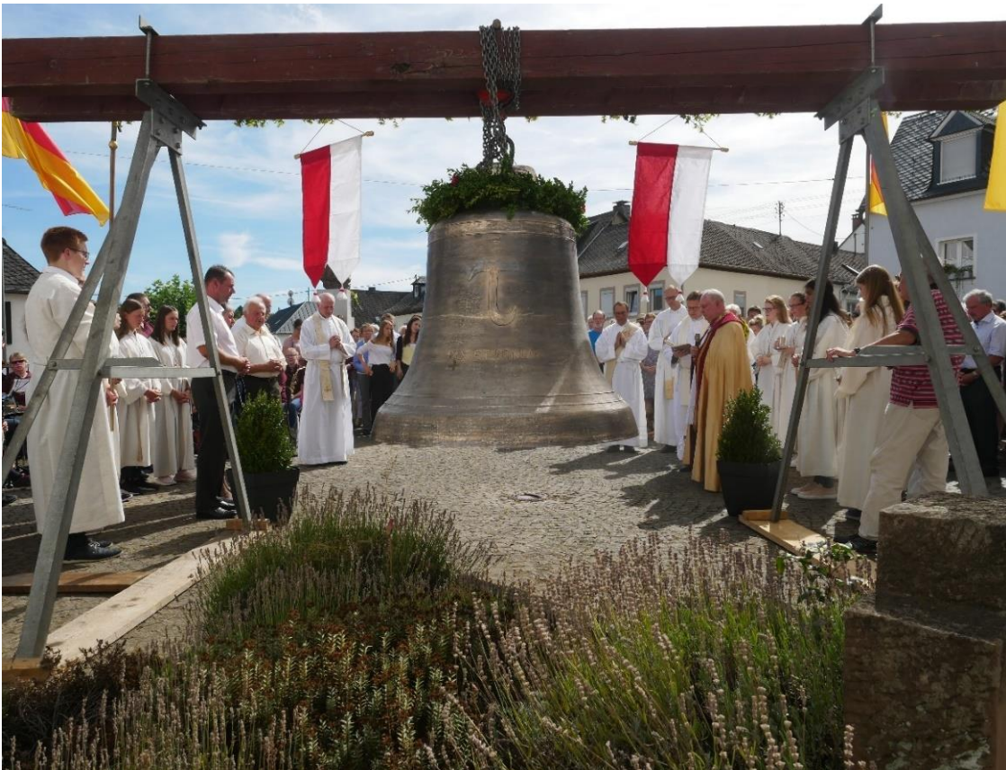
Glockenweihe am 12. August in Manderscheid